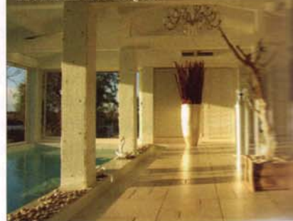
LE MAS DE LA FOUQUE.

• Prix par nuit pour deux personnes en demi-pension (du 17 mars au 3 juillet) : 320 € (360 € dans une roulotte tzigane). Formule découverte Beauté de 2 h 20 : 160 €. Le Mas de la Fouque, route du Petit-Rhône, 13460 Les Saintes-Maries-de-la-Mer, tél. 04 90 97 81 02. / E. C.